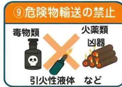
⑨ 危険物輸送の禁止