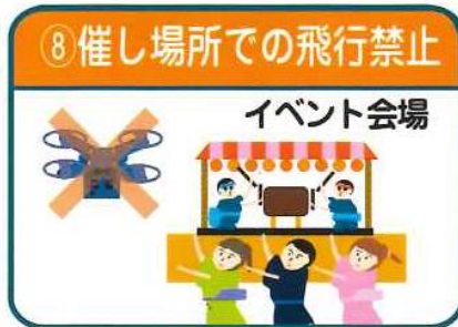
⑧ 催し場所での飛行禁止

※3: 人（第三者）又は物件（第三者の建物、自動車等）との間に30m以上の距離を保つことが必要です。