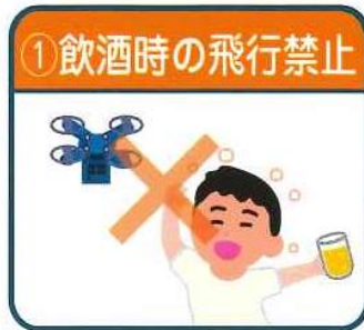
① 飲酒時の飛行禁止

★ 飛行の方法 ※ ⑤～⑩の方法によらずに飛行（例：夜間飛行、目視外飛行等）させたい場合には、国土交通大臣の承認が必要です。